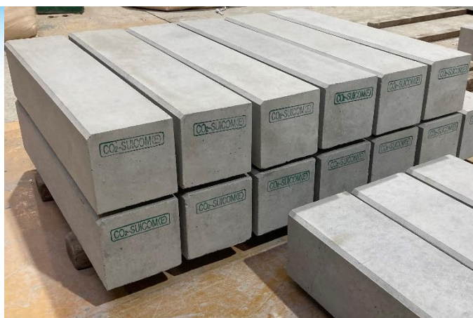
図 CO 2 -SUICOM、いろは蔵パークへの納入製品