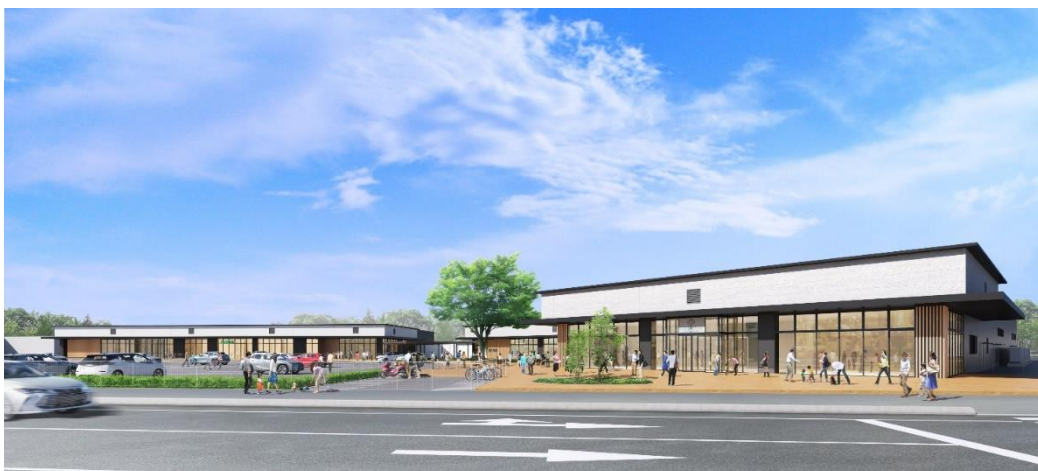
図 いろは蔵パーク完成イメージ

「いろは蔵パーク」は、江戸～明治時代にかけては米蔵「新井田蔵」（通称「いろは蔵」）として酒田市の交易を支え、1917～2012 年にかけては山形県立酒田商業高等学校（前身の附設商業補修学校含む）として 90 年以上にわたり、多くの生徒で賑わっていた、歴史ある地に開業する商業施設です。地域の歴史と再生のシンボルとして、生活利便性の向上、地域交流の拠点形成、自然と人が出会い交流する空間の創出を目指し、2025 年 3 月 27 日（木）に一部店舗がオープンいたします。