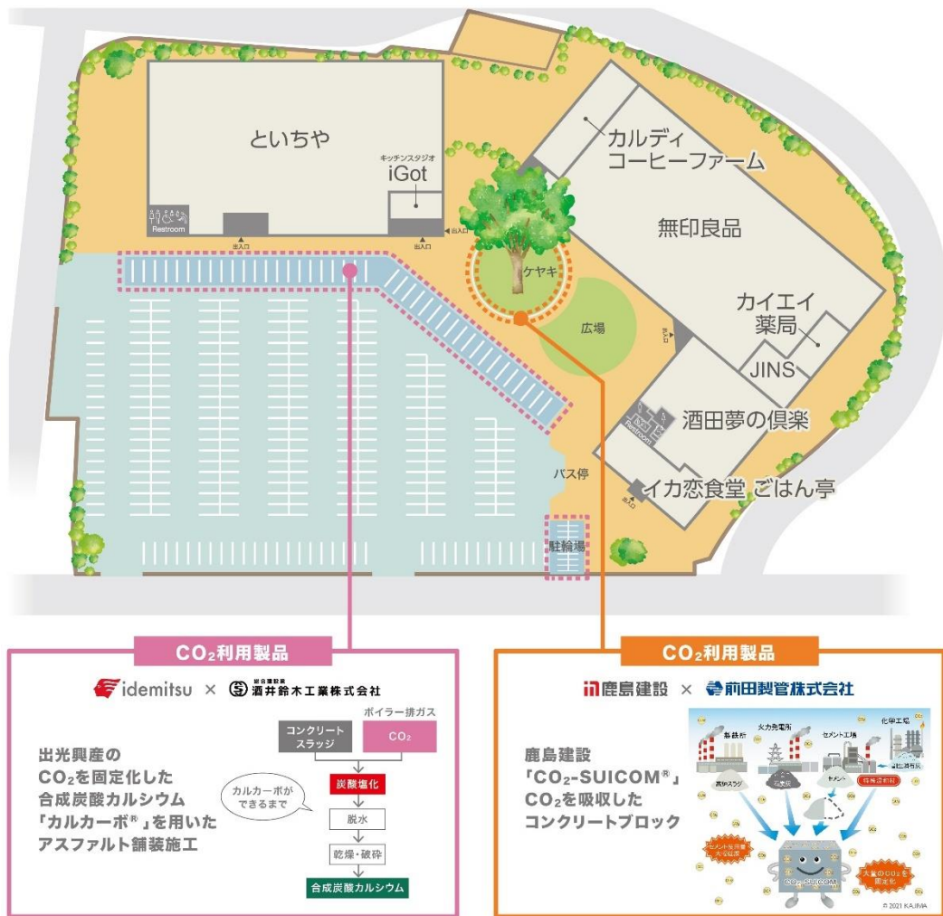
図 いろは蔵パーク導入状況