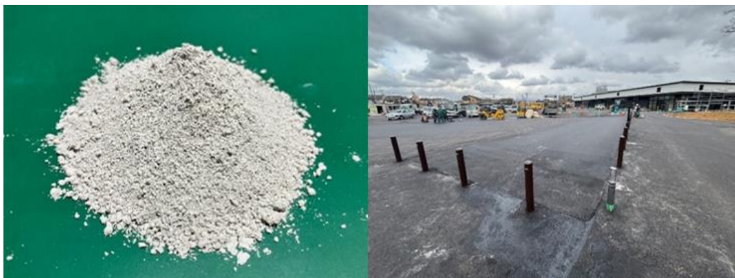
図 カルカーボ製品、いろは蔵パークへの導入状況

出光興産および酒井鈴木工業は、出光興産の製品「カルカーボ」を用いたアスファルトの敷設を実施しました。「カルカーボ」は、ボイラー排ガス中のCO 2 を産業廃棄物（コンクリートスラッジ）中のカルシウムと反応させて固定化した合成炭酸カルシウム（炭酸塩）であり、土木建設材料や化学品等への活用が期待されます。