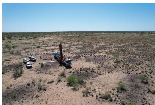
採掘予定地（ジュリアクリーク）