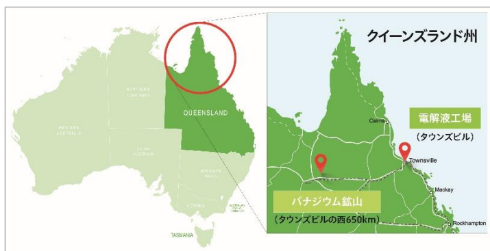
プロジェクト位置図

鉱物資源に恵まれる豪州には、バナジウムやリチウムといった多くのクリティカルミネラルが賦存しています。当社は、約45年にわたり豪州で石炭鉱山の操業に携わってきました。これまで培ってきた人財や、開発・生産・輸送・貯蔵・出荷に関する知見、豪州政府・現地ステークホルダー・お客様との関係性などの事業基盤を生かしながら、Vecco社とともにプロジェクトを着実に進めます。プロジェクトを通し、豪州を起点としたクリティカルミネラル事業へ本格進出し、米国等も含めた事業展開と再生可能エネルギー導入拡大への貢献を目指します。