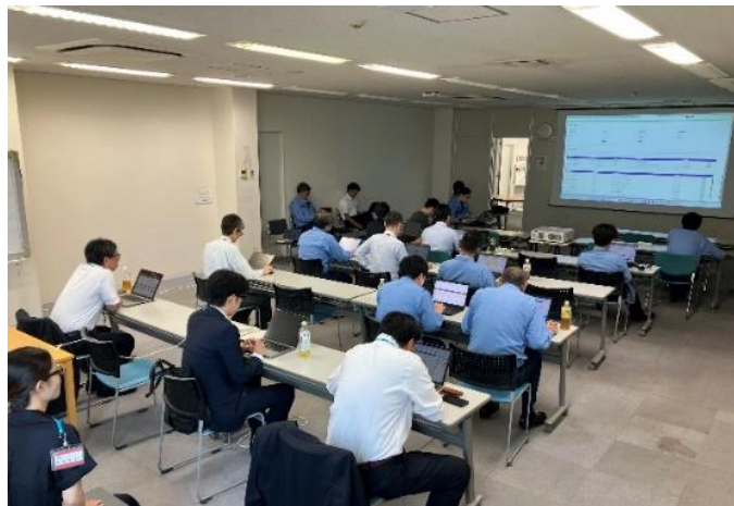
導入説明会の様子

※IT(Information Technology; 情報技術)、OT(Operational Technology; 運転技術)、ET(Engineering Technology; 工学技術)