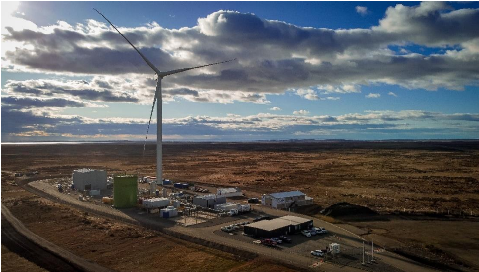
HIF 社の Haru Oni 実証プラント（チリ）