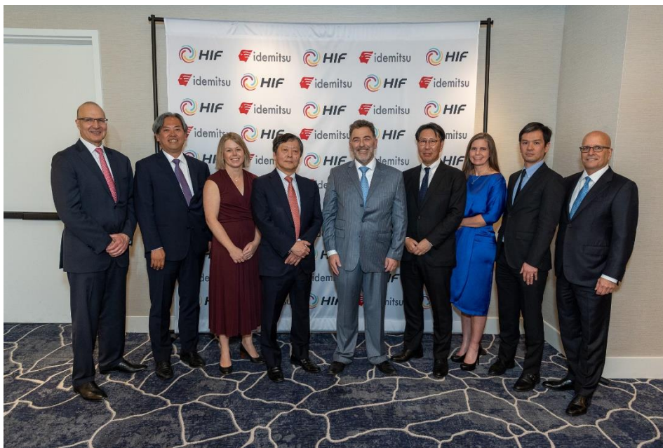
HIF 社との出資セレモニーの写真

当社は今後、当出資を通じ、合成燃料およびカーボンニュートラル燃料やその原料等として汎用性の高い e-メタノールの国内外におけるサプライチェーン構築を推進し、カーボンニュートラル社会への貢献を進めていきます。