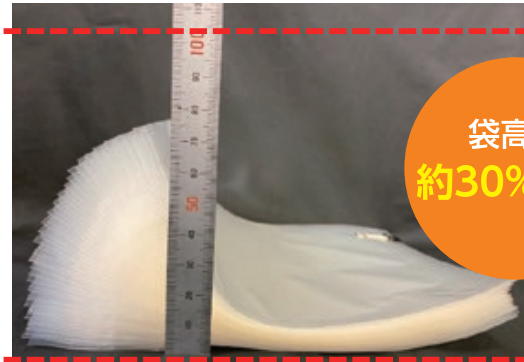
コンパクトジッパー