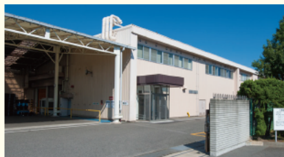
▲兵庫工場 「想いに応えて わくわくをカタチに」

みんながいつも食べているパンやお菓子など、生活の身近にある食品の包装物を作っています。ただ包むだけではなく、食品の鮮度を守ること、フードロス削減したり、電子レンジで簡単に短時間で調理できるようにするなど生活を便利にしています。