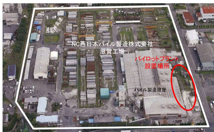
補助金事業実施場所 NC西日本パイル製造株式会社滋賀工場 (住所: 滋賀県湖南市柑子袋270)