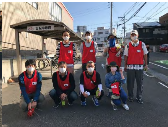
参加者で記念撮影