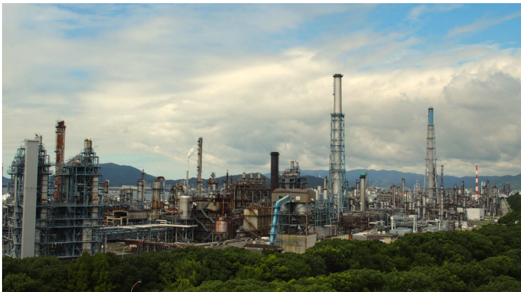
常圧蒸留装置撤去後の旧・徳山製油所